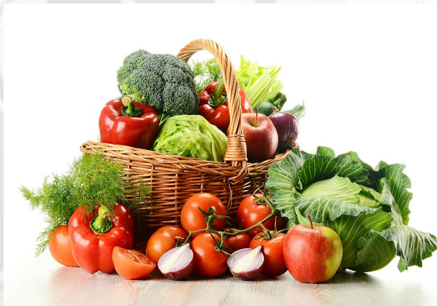
SU SFONDO BIANCO