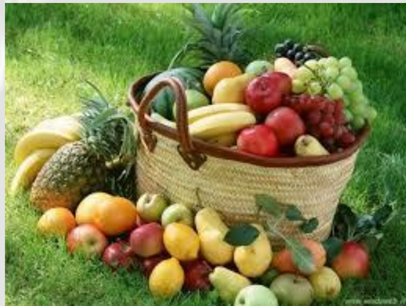
IN AMBIENTE ESTERNO

FONDAZIONE ITS AGROALIMENTARE PUGLIA Corso ITS VIII Ciclo 2018-20